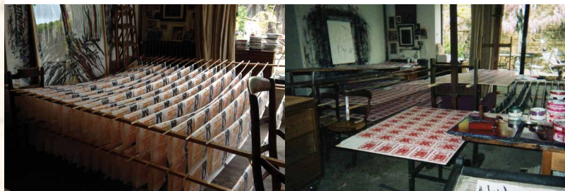
cop. la Goulotte

LES ÉDITIONS DE LA GOULOTTE FÊTENT 20 ANS DE COMPLICITÉS ARTISTIQUES